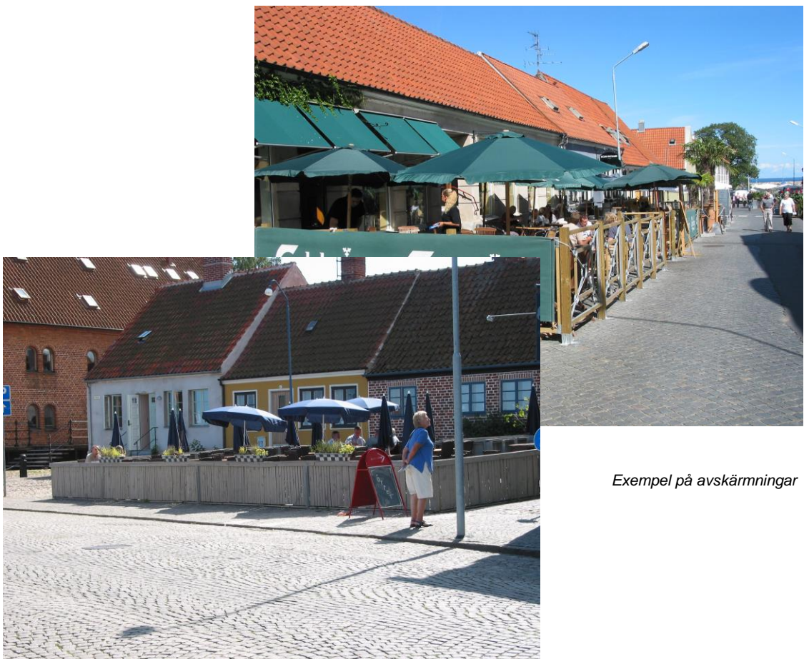
Exempel på avskärmningar

Serveringen ska vara avskärmd på samtliga sidor även ingångssidan. Avskärmningen ska gå från underkant 0,1 m över mark upp till 0,9 m över mark. Utformningen av avskärmningen ska vara fast, stabilt förankrad, i ljushetskontrast mot omgivande miljö, således inte tillverkad av rep, kätting eller dylikt. Utstickande föremål ska, vid undantagsfall förekommande, markeras med ljushetskontrast och reflex. Är avskärmningen i glas ska denna ha varningsmarkeringar, vilket kan utformas estetiskt och ändå uppfylla kravet. Vindskärmar skall vara enfärgade i vitt (vitgrå, beige), blått eller grönt och ej försedda med reklamtext. Dock är serveringens namn och logotype tillåtet.