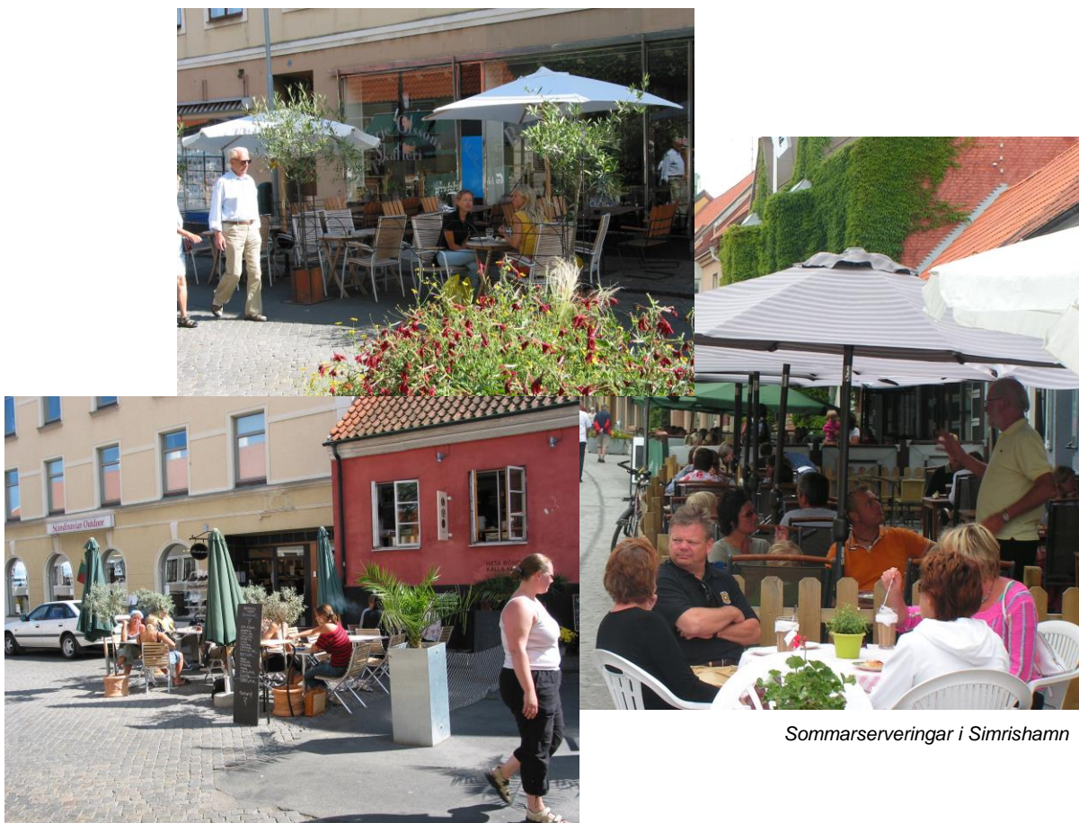
Sommarserveringar i Simrishamn

Dessa regler och riktlinjer är framtagna efter - Riktlinjer för nyttjande av allmän platsmark vid tillståndsgivning - som tagits fram för Simrishamn, Sjöbo, Skurup, Tomelilla och Ystads kommuner av tillgänglighetsrådgivarna.