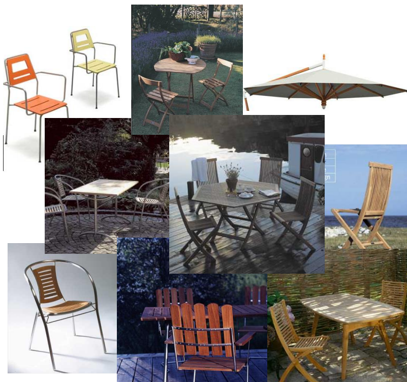
Exempel på möblering

Flexibel möblering inom avskärningen ger förutsättningar för ommöblering för olika behov av yta för t ex rullstol, rollator, barnvagn eller barnstol.